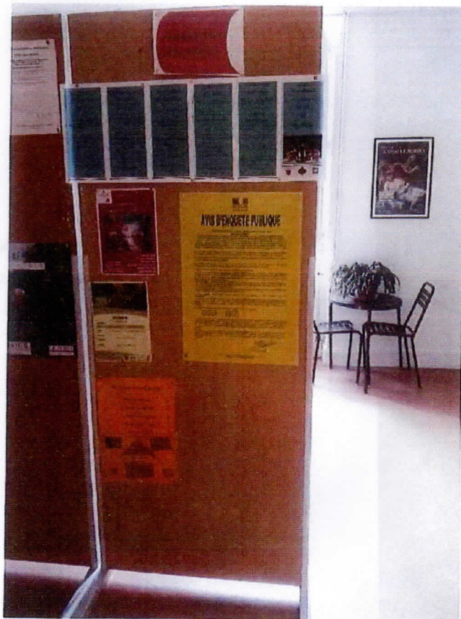
Affichage médiathèque - CONDOM

Vérifié le 19 février 2018 en présence du commissaire enquêteur : tous les panneaux sont présents.