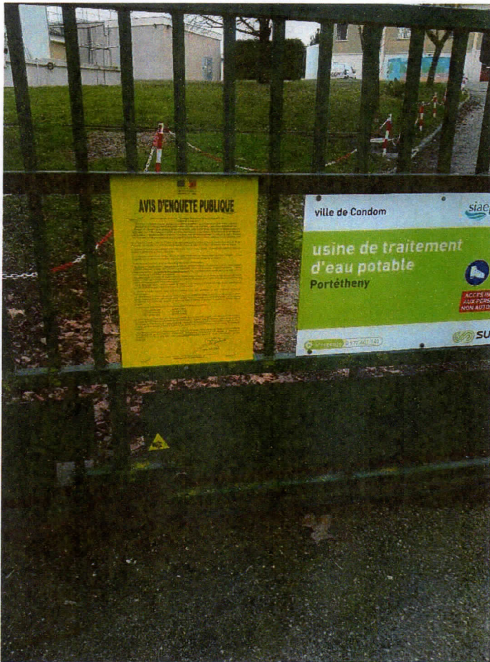
Affichage station de Portétheny - CONDOM