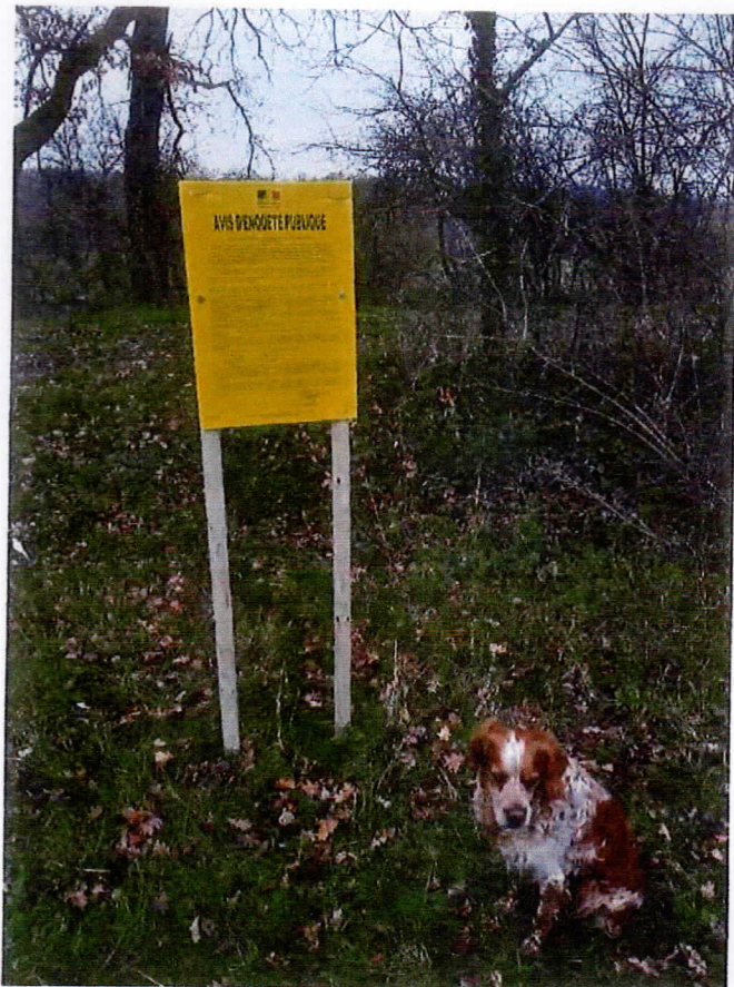
Affichage station de pompage de Brunet – Hameau de Las Branes