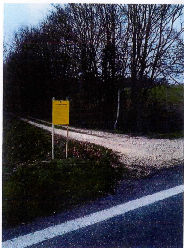
Affichage station de Brunet RD 930 – CONDOM Emplacement n°1