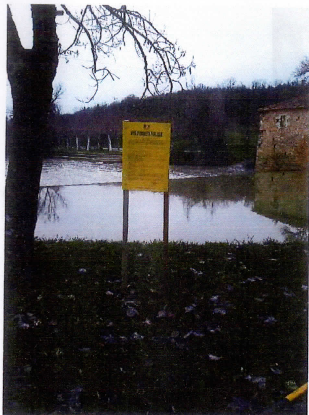
Affichage station de pompage Gauge – CONDOM Emplacement n°2