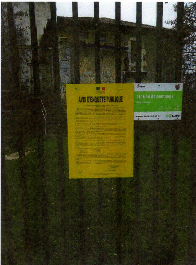
Affichage station de pompage Gauge - CONDOM Emplacement n°1