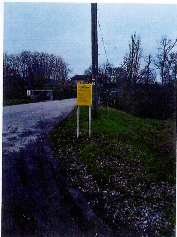
Affichage RD 142 - VALENCE SUR BAÏSE